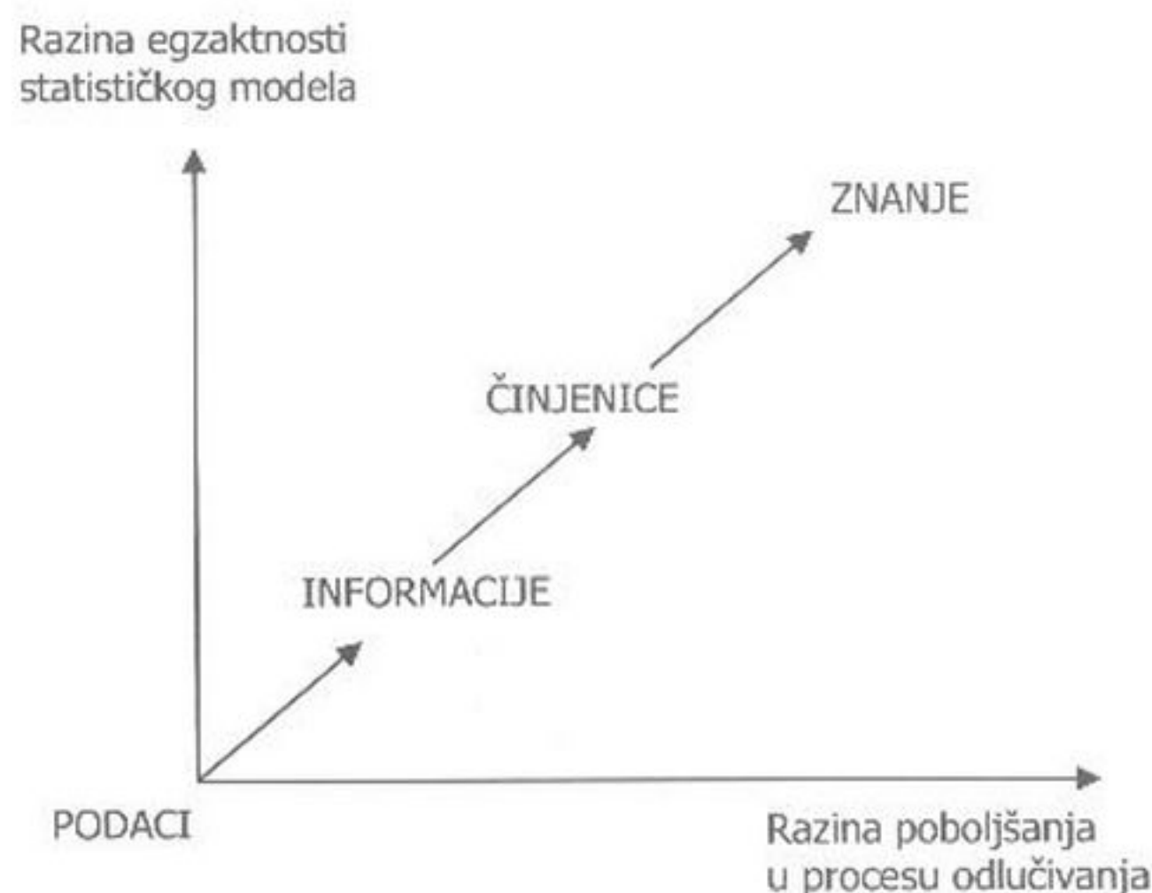
Slika 1. Ilustracija elemenata i kvalitete procesa konstrukcije statističkog modela temeljenog na podacima koji služi odlučivanju u uvjetima neodređenosti (varijabilnosti podataka).

Statistika je znanost koja potpomaže proces donošenja odluka (primjene znanja) u uvjetima neodređenosti, koristeći određen skup metoda za prikupljanje, analizu, prikaz i interpretaciju podataka. No prikupljeni podaci tek su ogoljene informacije koje ne predstavljaju znanje. Kako od podataka stići do znanja? Temeljni je kvalitativni niz: podatak → informacija → činjenica → znanje. Informacija je temeljni element komunikacije znanja. Podaci postaju informacije tek u trenutku kada su relevantni za proces odlučivanja. Informacija postaje činjenica , kada je potkrijepljena zaključcima analize podataka. Činjenice postaju znanje kada su iskorištene u uspješnom dovršenju procesa odlučivanja, potkrijepljenom pravilnom interpretacijom rezultata primijenjenog statističkog modela. Pri tom je konačno primijenjeno znanje izraženo zajedno s uvjetom neodređenosti (razinom statističke pouzdanosti). Kako se povećava razina točnosti (egzaktnosti) statističkog modela, tako se poboljšava kvaliteta procesa donošenja odluka (slika 1.). Zbog toga je u nizu od podataka prema znanju potrebno primijeniti statističku analizu, koja omogućava da se znanje temelji na dokazima potkrijepljenim podacima, a ne na uvjerenjima, mišljenjima ili vjerovanjima.