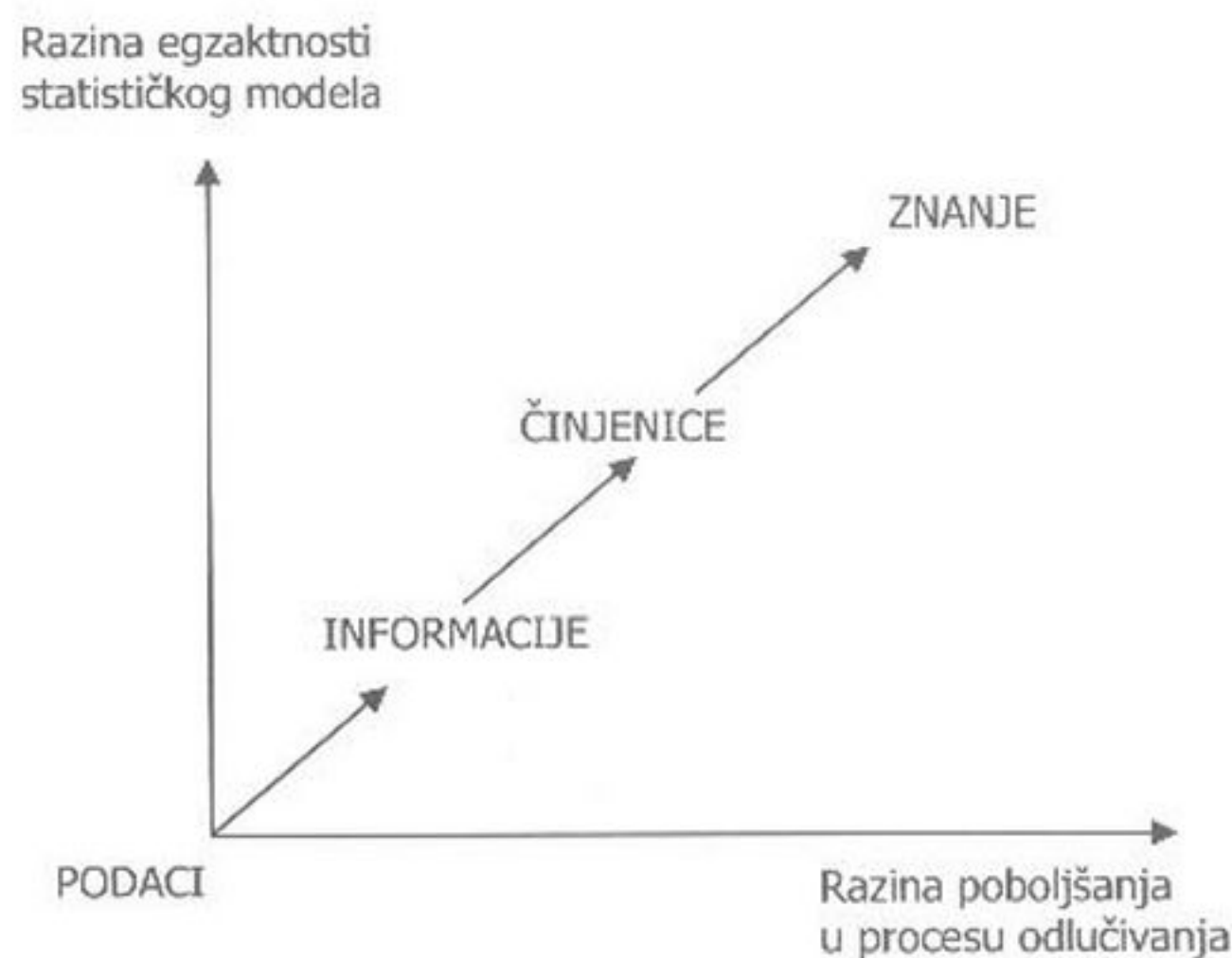
Slika 1. Ilustracija elemenata i kvalitete procesa konstrukcije statističkog modela temeljenog na podacima koji služi odlučivanju u uvjetima neodređenosti (varijabilnosti podataka).

Statistika je znanost koja potpomaže proces donošenja odluka (primjene znanja) u uvjetima neodređenosti, koristeći određen skup metoda za prikupljanje, analizu, prikaz i interpretaciju podataka. No prikupljeni podaci tek su ogoljene informacije koje ne predstavljaju znanje. Kako od podataka stići do znanja? Temeljni je kvalitativni niz: podatak → informacija → činjenica → znanje. Informacija je temeljni element komunikacije znanja. Podaci postaju informacije tek u trenutku kada su relevantni za proces odlučivanja. Informacija postaje činjenica , kada je potkrijepljena zaključcima analize podataka. Činjenice postaju znanje kada su iskorištene u uspješnom dovršenju procesa odlučivanja, potkrijepljenom pravilnom interpretacijom rezultata primijenjenog statističkog modela. Pri tom je konačno primijenjeno znanje izraženo zajedno s uvjetom neodređenosti (razinom statističke pouzdanosti). Kako se povećava razina točnosti (egzaktnosti) statističkog modela, tako se poboljšava kvaliteta procesa donošenja odluka (slika 1.). Zbog toga je u nizu od podataka prema znanju potrebno primijeniti statističku analizu, koja omogućava da se znanje temelji na dokazima potkrijepljenim podacima, a ne na uvjerenjima, mišljenjima ili vjerovanjima.