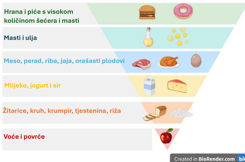
Slika 2, piramida zapadnjačke prehrane, Biorender