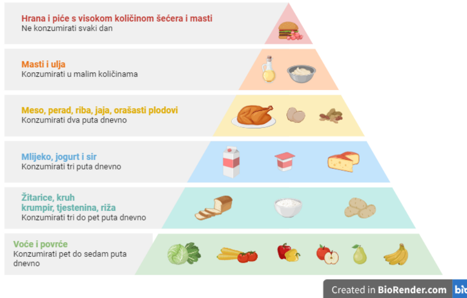
Slika 1, piramida pravilne prehrane, Biorender