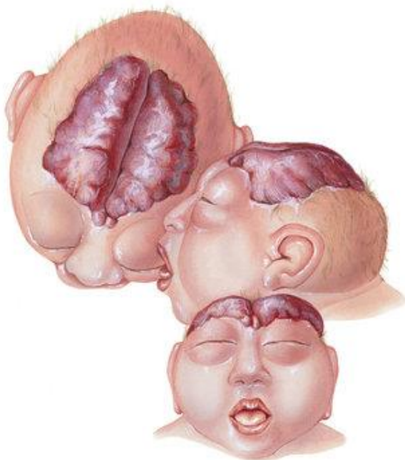
Slika 4, dijete s anencefalijom