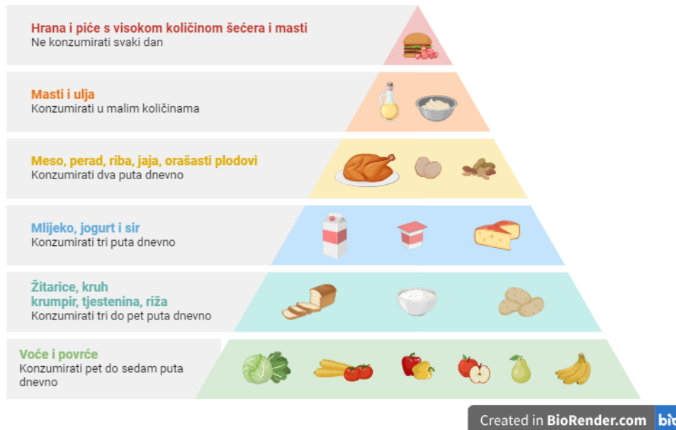
Slika 1, piramida pravilne prehrane, Biorender